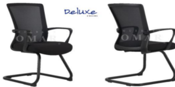
SILLA VISITA W-208BC-1

Sillon Raymond, ejecutivo con reposa cabeza, en tela de malla color negro, con base NIQUELADA con soporte lumbar, de primera calidad y con brazos ajustables, Linea Premium de CreActive, Garantia de treinta y seis (36) meses, soportan hasta 250 lbs