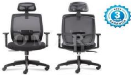
Vista posterior del sillón